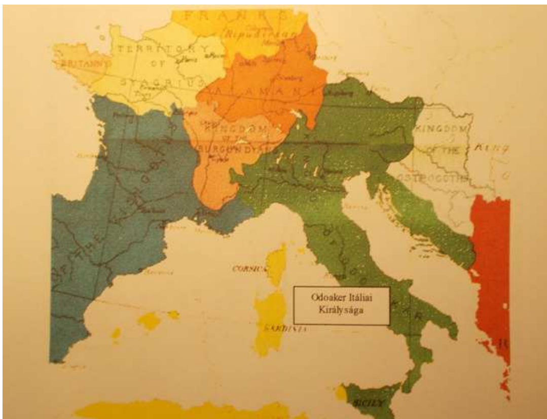
144. kép. Odoaker Itáliája 9

Odoaker Gallia kormányzója volt Napos császársága alatt, majd a hunvérű - utolsó nyugat-római császár, - Romulus Augustulus segítőtársa lett. Látva azonban ennek korrupt voltát - letaszítja a trónról és Itália királya címet veszi fel. Uralkodik 476-tól 495. március 15-ig. Egyesíti a Duna-menti hun törzseket. Noricumban és Pannoniában is jár személyesen. Odoaker Edihun (Edikon) fiaként jó iskolát járt és Atilla udvarában tanulta az uralkodás tudományát. Ez a hun dinasztia valóban nagyszerű szervezésben indult. A tulajdonképpeni irányító az apa - Edihun volt.