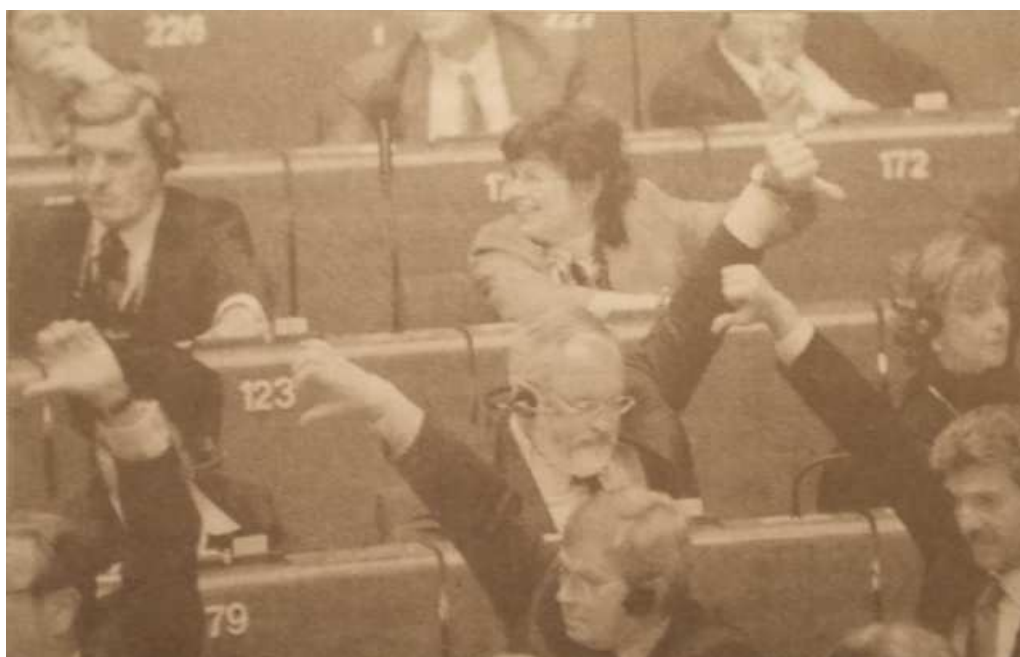
145. kép. Szavaznak a rómaiak. Szavazás Strassbourgban az Európai Parlamentben. 19

földrésnyi méretű európai eszméről eddig még nem hallottam. Nincs hozzá Isten sem. Ha pedig ilyen nem lenne, az szörnyű tragédia lenne ránk nézve, hiszen egy tisztázatlan szellemiségű alakzat lenne csak az, amibe olyan nagy erővel szeretnénk tartozni. Úgy tűnik, hogy a testiség birodalmához akarnánk oly elszántan csatlakozni? Hol van hát az alapító európai eszme? Mi vezeti ezt a földrészt egyesülése után? Netán a gátlástalan haszonelvűség? Vagy a minden hagyományt taroló szabadosság egyformásító hamis ígéretei? Netán iskoláink, egyetemeink tengerentúlra való lebutításának kényszere, hogy a valamikori érettségit most lepusztított szintű egyetemek értéktelen diplomája helyettesítse? Netán új falansztert kerítenének valakik titokban a kábítószeren szétrombolt társadalmakban? Vagy netán megint boszorkányüldözések, inkvizíciók, kiátkozások is lesznek ebben a nagy országban? Megannyi új kérdés megválaszolatlanul. Európa most ugyanott tart, ahol Róma a köztársaság idején. A hódító lendület – a csatlakozásokkal – még tart. És előbb-utóbb jönni fog egy új Cézár is. Lesz majd új Augustus császár is a birodalomhoz. A pénzarisztokrácia ebből is kiszivattyúzza majd a pénzt, ahogy Rómában is, nem törődve azzal, hogy mi marad utána. És ha az is összedől, lesz utána még nagyobb pusztulás a lelkekben.