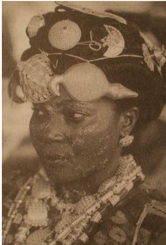
143. kép. Afrikai asante leány 5