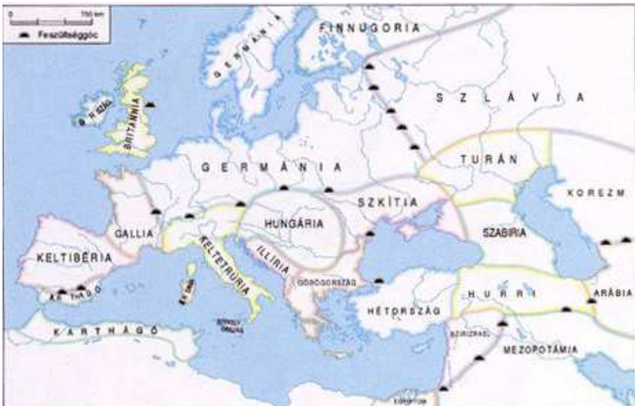
144. kép. Egy Róma nélküli világ

Felmerül a kérdés, mi lett volna, ha ... ? Pusztán elméleti jelentőségű lehet a történészek által méltán nem kedvelt kérdés. Ezúttal mégis felvázolom a lehetséges választ, mert igen jól látszik belőle, mit is veszítettünk a nagy győzelemben, amelyet megmaradásunkért vívtunk meg. Mi lett volna, ha az ellatinosodó Róma nem támad rá Európára, a világra és Latium békés tartomány maradt volna? A mai valósághoz képest talált eltérés alapján Róma működésének tulajdonítható. Nem állítom, hogy háborúmentes világot kaptunk volna nélkülük, de bizonyosan gyökeresen más történelmet kellene ma tanítanunk utódainknak.